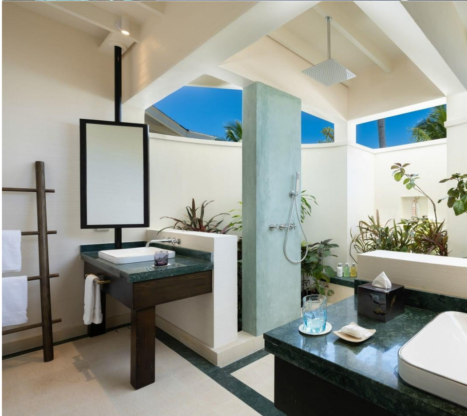
The FUSHI plan

** ชำระค่าทัวร์ซื้อบริษัท นิดน้อย ทราเวล เท่านั้น **