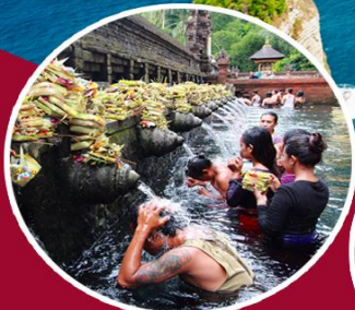
น้ำพุศักดิ์สิทธิ์