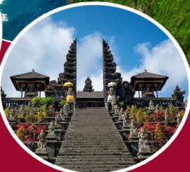
วัดเบชาที