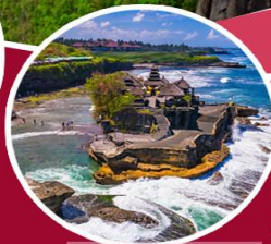
วิหารทานาล็อท