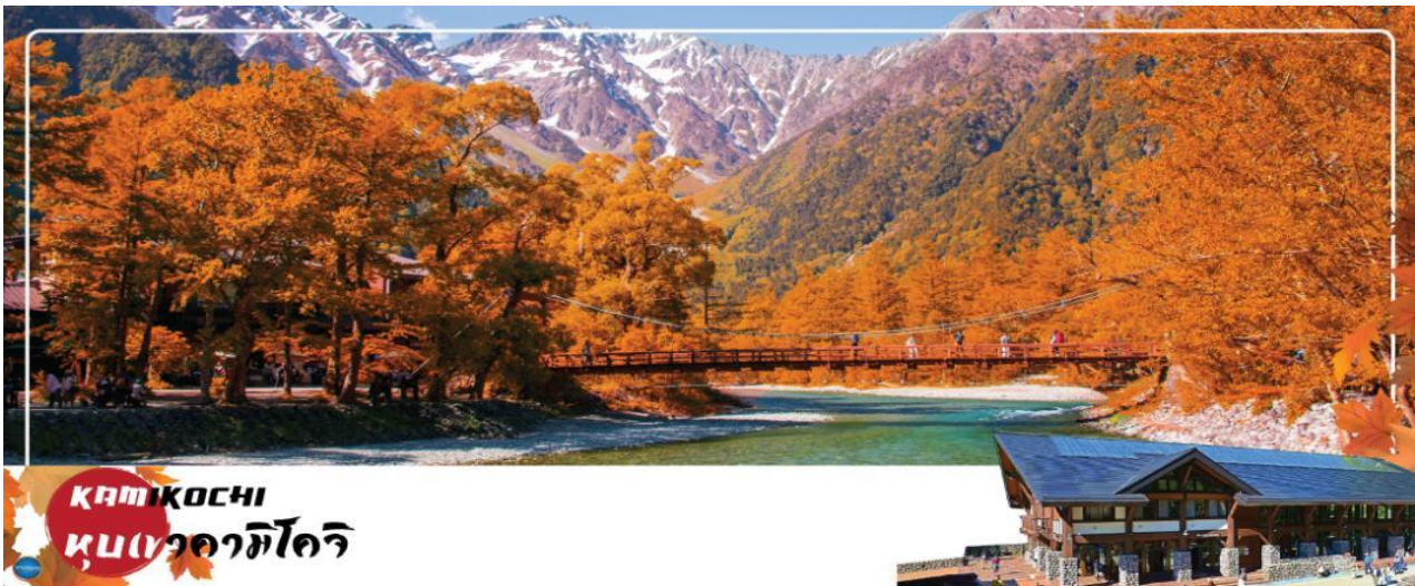
คามิโคจิ หุบเขาวชิไดริ

วันที่สาม เมืองนากาโนะ – คามิโคจิ – เมืองมัตสึโมโตะ – กรุงโตเกียว – ชมแนวยักษ์3มิติ พร้อมช้อปปิ้งย่านชินจูกุ