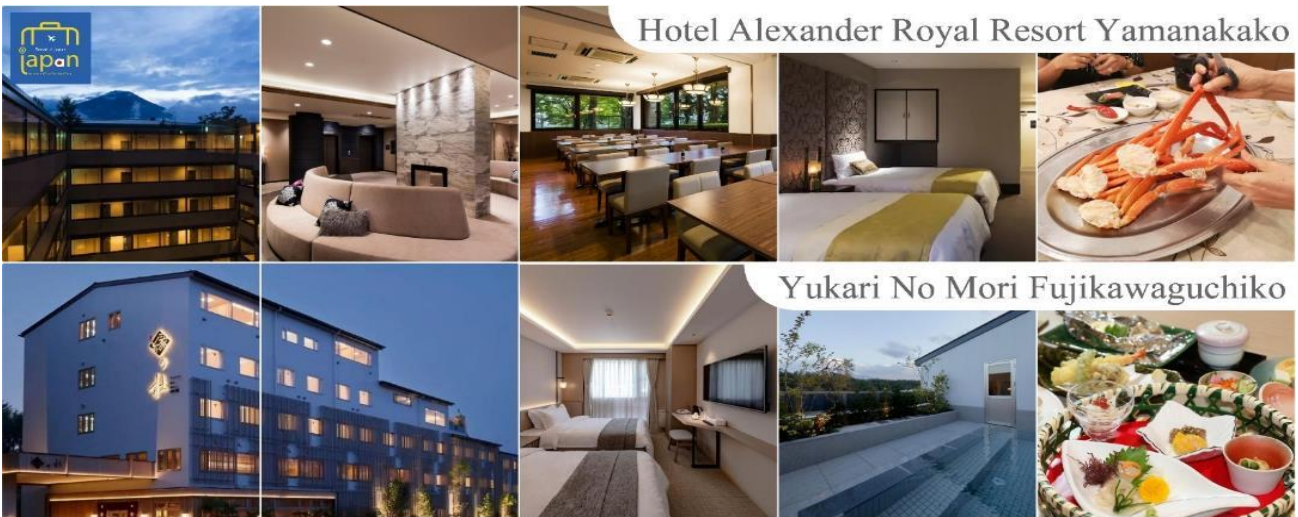
Hotel Alexander Royal Resort Yamanakako

พักที่ ホテル縁の杜河口湖 YUKARI NO MORI หรือระดับเดียวกัน หลังอาหารให้ท่านได้ผ่อนคลายกับการแช่น้ำแร่ธรรมชาติ เชื่อว่าถ้าได้แช่น้ำแร่แล้ว จะทำให้ผิวพรรณสวยงามและช่วยให้ระบบหมุนเวียนโลหิตดีขึ้น