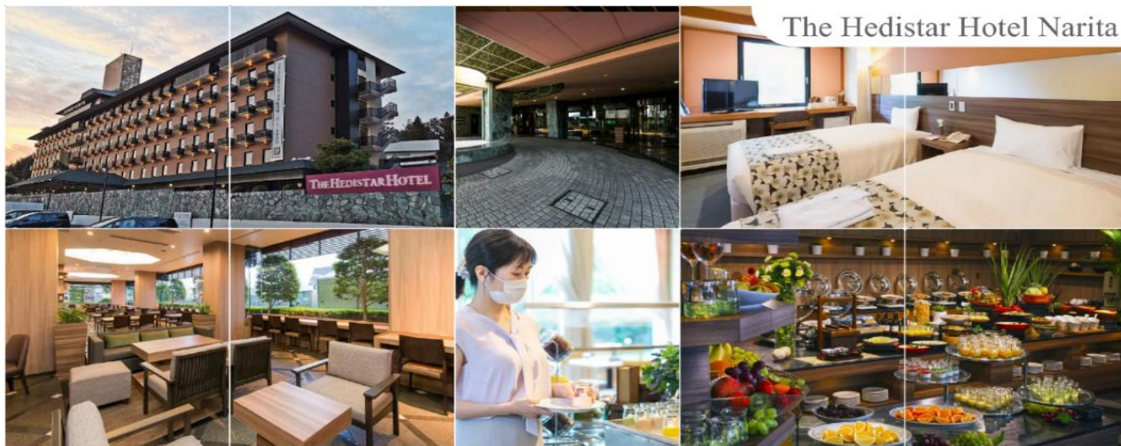
The Hedistar Hotel Narita

** ชำระค่าทัวร์ชื่อบริษัท นิดน้อย ทราเวล เท่านั้น **