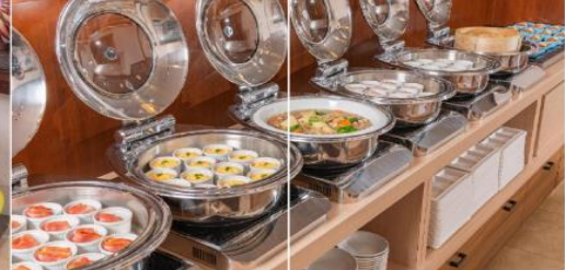
Alpico Plaza Hotel

พักที่ ALPICO PLAZA HOTEL หรือเทียบเท่าระดับเดียวกัน